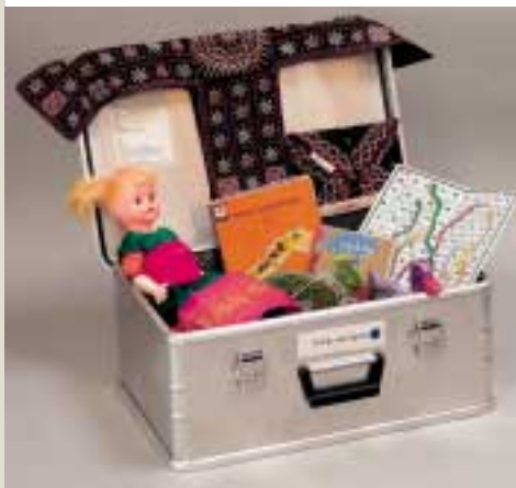
Päd. Koffer CITIM: Indienkoffer Teil 1: Schule und Spiele