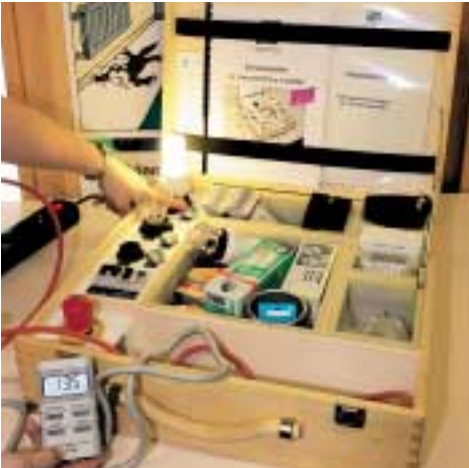
Energiesparkoffer für Energiedetektive