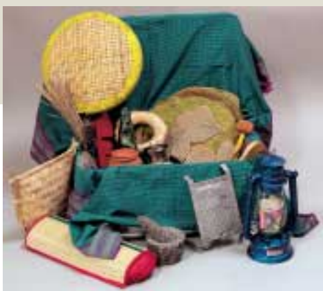
Päd. Koffer CITIM: Indienkoffer Teil 3: Haushalt