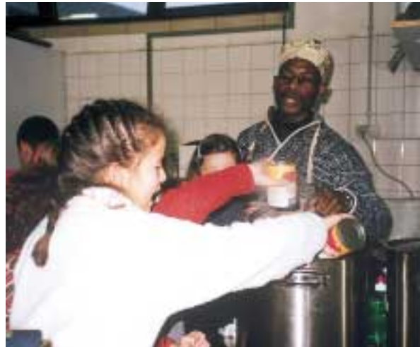
Les enfants de l'école primaire de Moutfort font la cuisine africaine (*)

(*) Contact pour cette animation: Coordination nationale Nord-Sud / ASTM / Robert Bodja