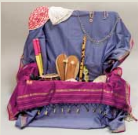
Päd. Koffer CITIM: Indienkoffer Teil 2: Schmuck, Kleider, Musikinstrumente