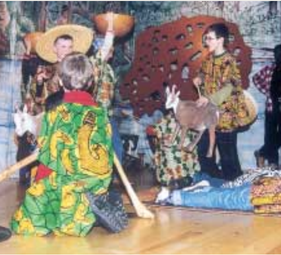
Les enfants de l'école primaire de Tandel dans la pièce de théâtre: La Vie au Village Africain (*)

Dans le cadre de la coordination nationale, l'Action Solidarité Tiers Monde poursuit la philosophie d'une double approche dans son action au développement: appuyer les peuples du Sud et sensibiliser au Nord. Dans cette optique, les communes membres de l'Alliance cofinancent les projets de nos partenaires du Sud et nous leur offrons un travail de sensibilisation pour différents groupes d'habitants.