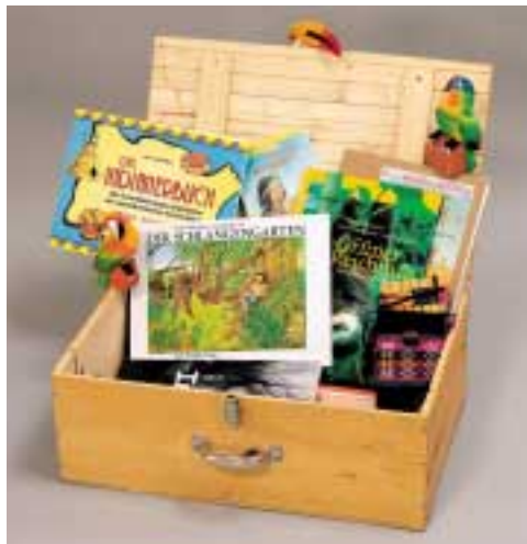
Koffer: Indigene Amerikas: Kultureller Reichtum der amerikanischen Ureinwohner

Es stehen insgesamt 3 Exemplare des Koffers zur Verfügung, die vor- oder nachbereitend im Rahmen von "Klima, Kanu, Quetschekraut" oder unabhängig davon eingesetzt werden können. Zielgruppe ist Primär- und Sekundarschule, insbesondere 4.-6. Schuljahr. Zwecks Ausleihe wenden Sie sich bitte an die nationale Koordination/ ASTM / R. Marchewka.