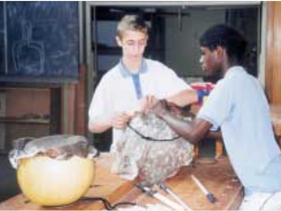
Les jeunes construisent le Bara: un instrument de musique du Burkina Faso (*)